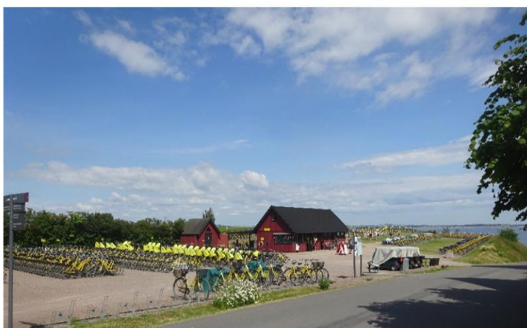
Over 1000 cykler stod og ventede på turisterne – kunne ikke få dem alle med på billedet.

Efter at have handlet ind så startede turen mod Ven eller Hven på dansk. 1½ time tog det at sejle fra Tuborg havn og herop. Ret begivenhedsløs tur med meget lidt adspredelse. Kun lige til sidst var der en større motorbåd som lå lidt bag om mig og med ca. samme hastighed. Det var helt tydeligt, at da han vurderede at jeg ville komme først til havnehullet, så fik den en spand kul. Han nægtede at hilse på mig, da jeg kom til at lægge til lige ved siden af ham. – Det var en dansker!