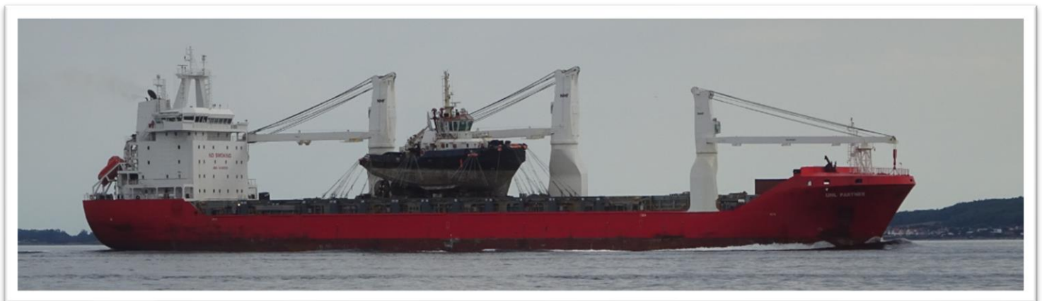
Redningsbåd på dækket?

Trafikken i Øresund er tæt og der var mange skibe og lidt af en udfordring at krydse separations linjen mellem Helsingør og Helsingborg. – måtte vente på 5 store skibe der kom fra nord i en lang række.