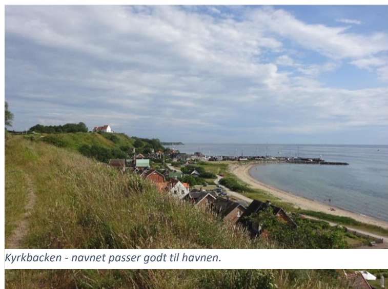
Kyrkbacken - navnet passer godt til havnen.

Så var der dømt cykeltur rund på øen med besøg på Tycho Brahe Museet. Det var lidt af en