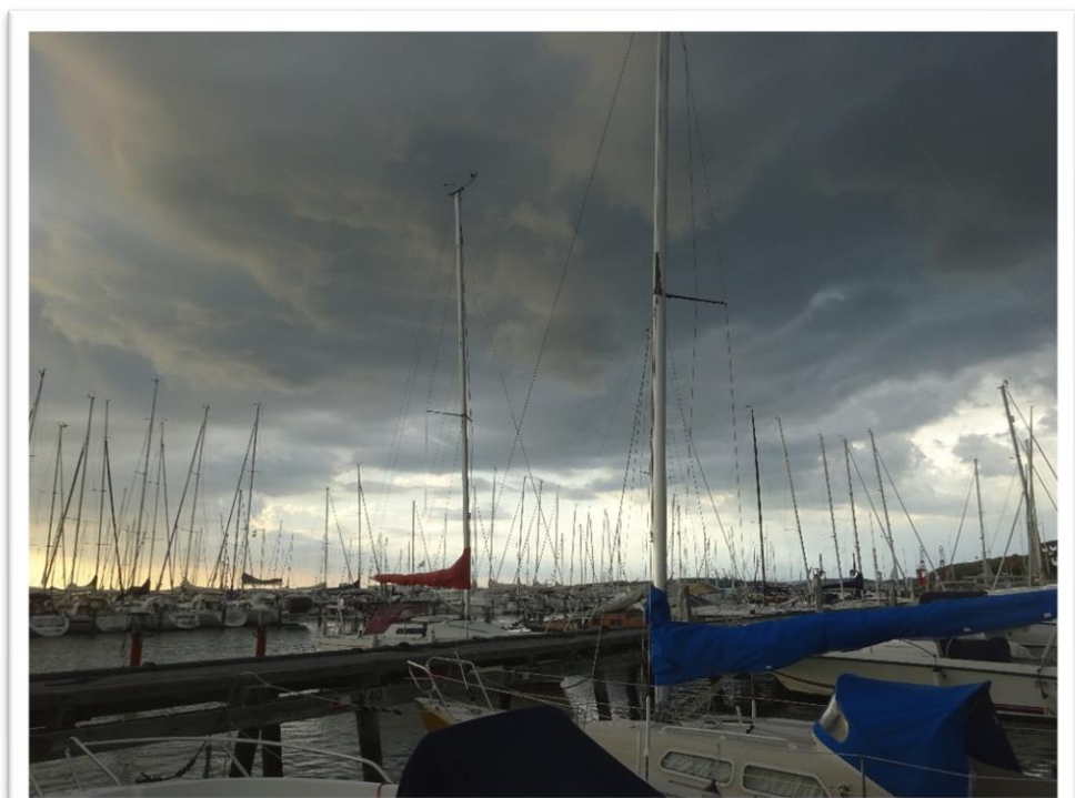
Tordenskyer hen over Göteborg

Tilbage i båden kunne jeg se et vejrskifte på vej, og efter en helt utrolig sommerdag var der nu lagt op til et ordentligt omgang tordenvejr.