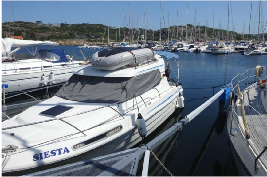
Kullavik havn i solskin, med så meget solafskærmning som muligt – betyder meget for temperaturen inde i båden.

langt på turen at resten af vejen til Göteborg kommer til at foregå indenskærs og med kun 16 sømil tilbage, er vejrudsigten er ikke så afgørende, når jeg skal nå at hente familien på søndag. Det betyder 4 dage hvor jeg kan finde de mest interessante områder og havne der er at besøge i området