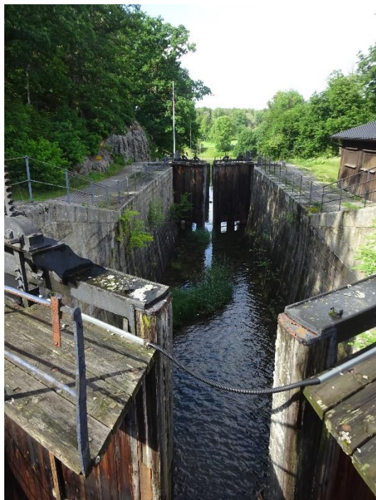
Billede af de gamle sluser fra 1844

Og i 1912 åbnede de nuværende sluser (mærket C på kortet), som nu hver kan løfte 6 meter – og med i alt 4 sluser overvinder de en højdeforskel på 24 meter.