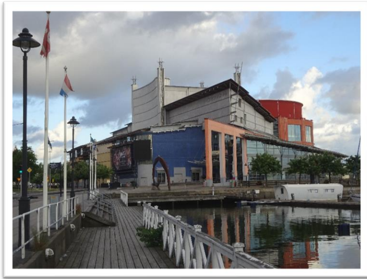
Operahuset i Göteborg