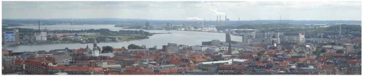
Udsigten fra tårnet mod nord/øst ind over centrum af Aalborg