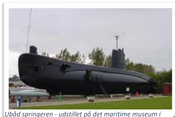
U-båd Springerens - udstillet på det maritime museum i Aalborg

Så blev der tid til det lokale maritime museum, og afgjort et besøg værd, hvis man bare er en lille smule maritimt interesseret. Bl.a. med mulighed for at komme ind i Springerens – den sidste danske u-båd der var i aktiv tjeneste. Det må virkelig have været noget af en udfordring, at være i en båd der sejler under vandet - ikke mindst pga den meget trange plads ombord. Det ville ikke noget for mig.