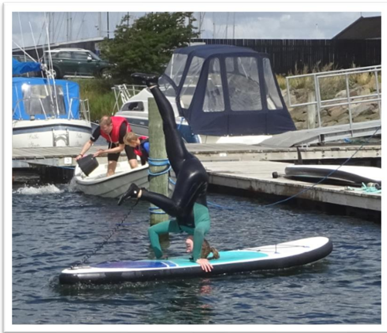
Ung pige der forsøger at stå på hovedet - det lykkedes næsten, medens far og lillebror er i gang med at tømme jollen for de mange liter vand, der er kommet fra oven de sidste par dage.

Det har de sidste par dage været lidt tynd med relevante og nye historier, men når jeg nu ikke vil/kan sejle, er det godt med aktiviteter på vandet lige uden for vinduet.