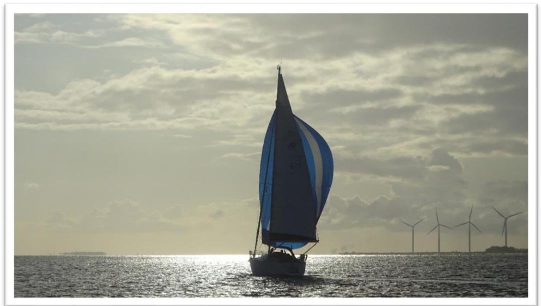
Motiv fra Limfjorden og synes selv at det er et godt billede af en sejlbåd midt i solskinsstriben

Så afsted mod Hals – årsagen til det lange stræk var et kig på vejrudsigten – onsdag lover de frisk vind fra Syd. Hvis jeg ikke når til Grenå senest tirsdag, vil det ikke være en fornøjelse at skulle sejle fra Hals til Grenå.