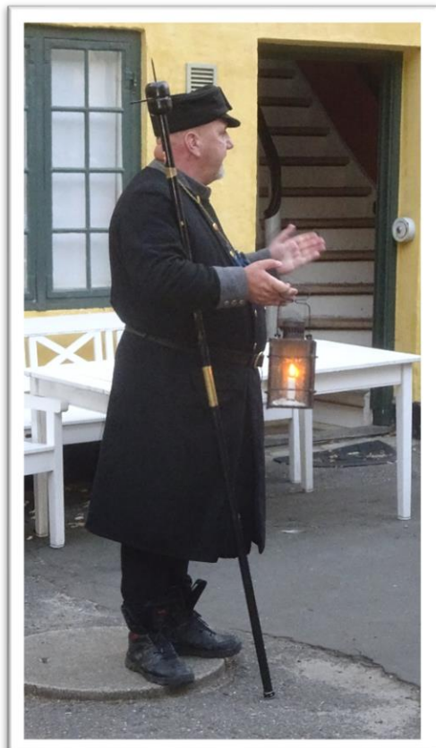
Hold på 4 vægtere skiftes til at gå rundt i Faaborgs gader og fortælle historier, hver aften i sommertiden.

Heldigvis var der ikke mange personer, på havnen som så mit "lille" uheld, ellers var jeg nok fortsat til næste havn. 😊