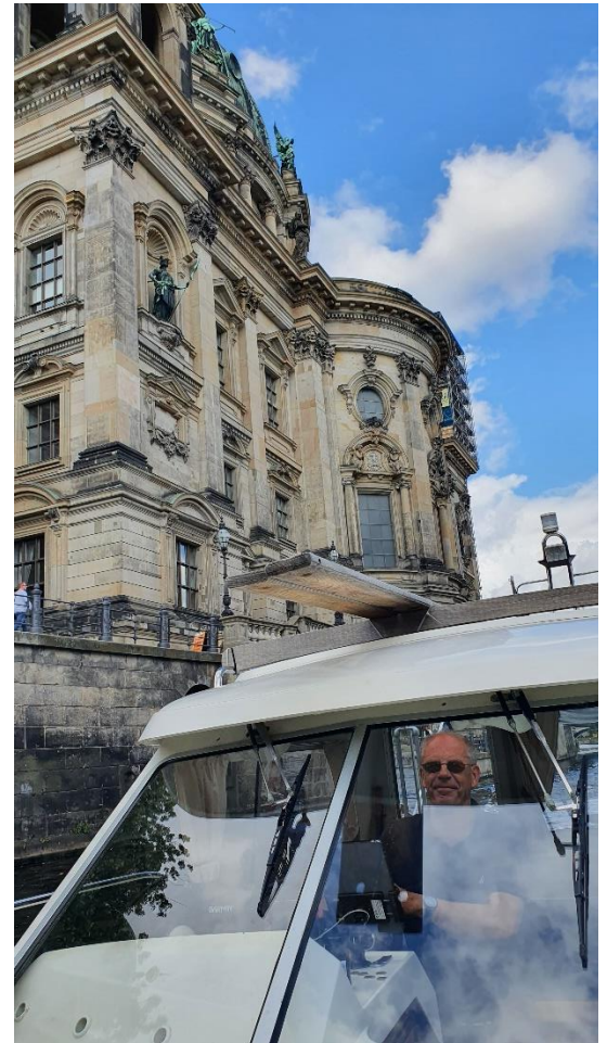
Kommer meget tæt på de historiske bygninger når turen går ind midt gennem Berlin

Tidlig op og afsted – men først blev der tid til en gåtur – her er et lille udpluk af de fascinerende bygninger der lå i området.