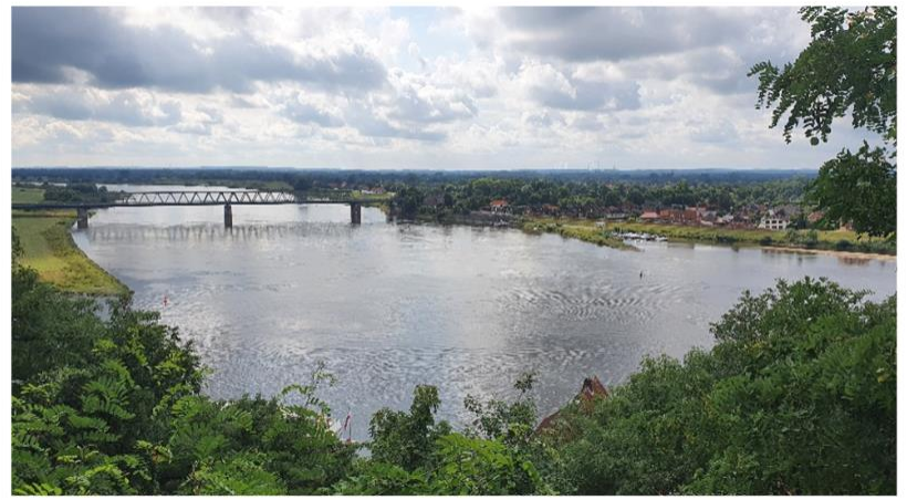
Her er et lille udsnit af Elben, men at tænke sig at der har ligget en træk-kæde i hele flodens længde på 740 km er slet ikke til at forestille sig.

Men det er ikke kun i gamle dage at mennesket var kreativ og fandt på nye løsninger på problemer. Nabobåden i Lauenborg havde løst sit problem med bovpropel på en helt ny måde. Det er svært at se på billedet, men en box var monteret på stævnen af båden, og så var systemet sådan indrettet at han kunne sænke propellen ned i vandet via en fjernkontrol og selvfølgelig på samme måde aktivere selve propellen. – Genialt da han slipper for at lave hul gennem båden og der er ikke noget drag fra systemet når han ikke bruger