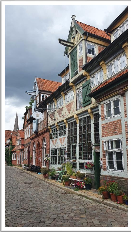
En af de flotte gamle bygninger i Lauenborg

Vælger en overligger dag i Lauenburg – fin gammel by med mange interessante bygninger, men også et skibsmuseum der absolut er et besøg værd. Der var dog en oplysning som virkelig var overraskende og som jeg ikke kendte til. Omkring århundredes skiftet blev der lagt en kæde på bunden i hele Elbens længde – 740 km. Og en specialbygget dampbåd kunne ved hjælp af et spil på dækket trække 10-12 lastpramme efter sig. Museet viste 4½ meter af den kæde, men at tænke sig at den har været så lang er ikke til at fatte.