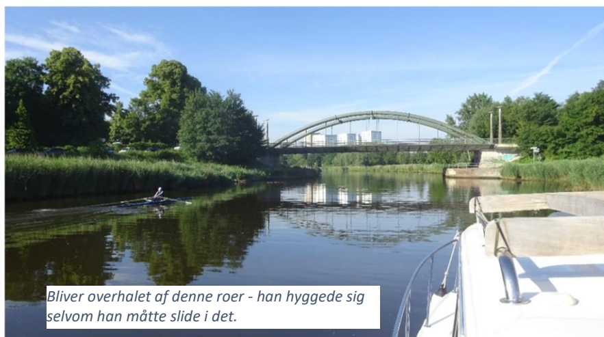
Bliver overhalet af denne roer - han hyggede sig selvom han måtte slide i det.

Det kræver tålmodighed at sejle på kanaler.