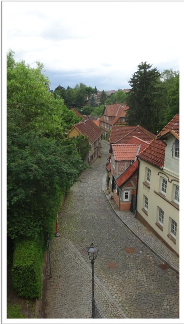
Kig ned på en del af den gamle by fra broen der fører over til slottet

Dagen byder på kun 2 sluser – begge går nedad mod Elben efter at have være hævet 25 meter i de første 5 sluser.