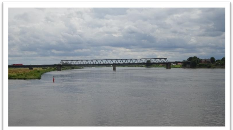
Elben ved Lauenburg, hvor kanalen kommer ind fra venstre

Hvis den nuværende udvikling af havnepenge fortsætter så ender det med at vi får betalt ophold. I Lauenburg kom vi ned på 10 €, og stadig med fuld service i form af EL, vand og brusebad – alt inkluderet i prisen.