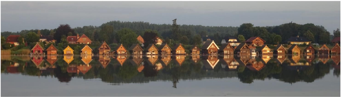
Når vi nu ikke kan sejle, så kan tiden bruges til at tage billeder fra havnen. Flot morgen med helt stille vand og sol på bådhusene på den anden side af søen.

Kl. 7:30 ingen liv i den båd som ligger og spærrer – men kl. 8:00 sejler de som aftalt, selvom vi gerne ville have været afsted noget før