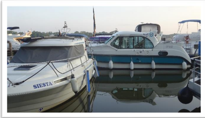
Udlejningsbåd med besætning fra Svendborg - Designet af båden kan diskuteres

Første stop er i Rechlin hvor det er nødvendigt at få provianteret – vi er gået tom for næsten alt, så nu skal der handles ind i den lokale NETTO.