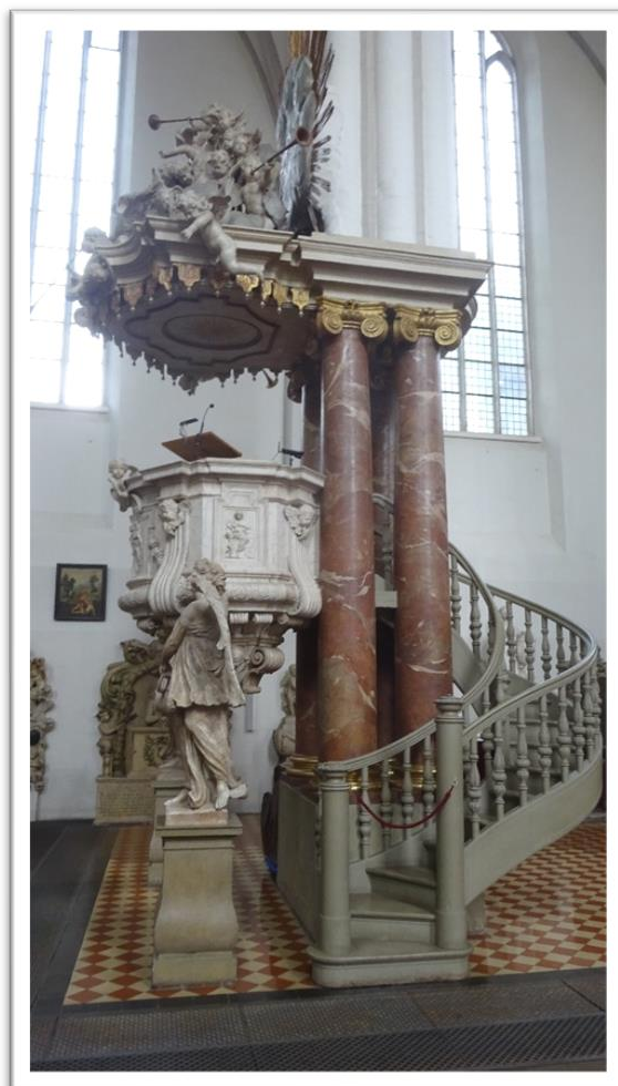
I en kirke, faldt vi over denne fantastiske prædikestol. I

Vi har på turen ikke oplevet problemer – eller skulle vise Corona pas, dog er de i Tyskland, ikke sluppet af med mundbind – det skal stadig anvendes i alle butikker, offentlig transport og indendørs seværdigheder.