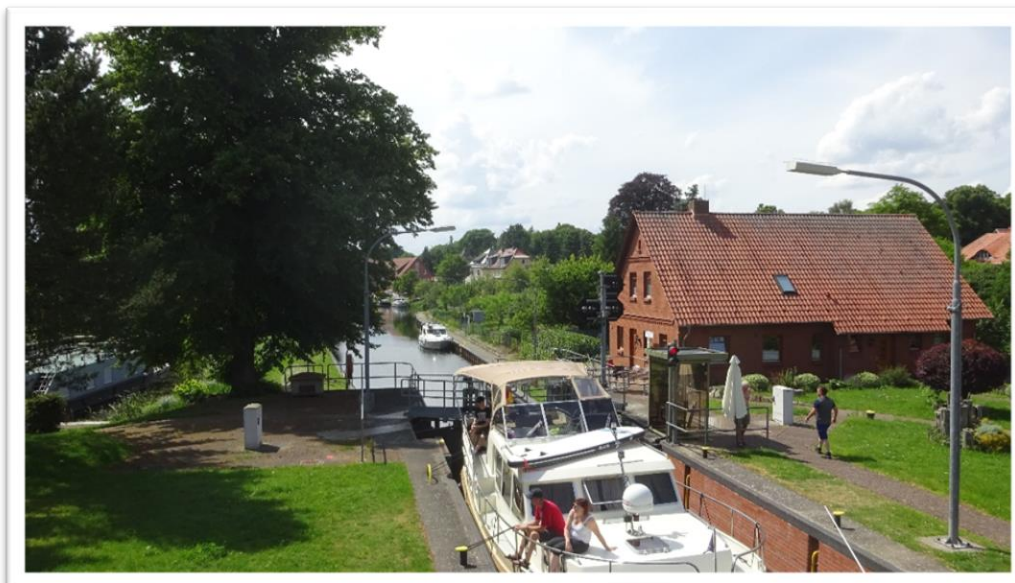
Slusen hvor vi kom til at vente i 2 omgang, frokostpause m.m.- så det tog over 2 timer at komme igennem. Som det fremgår af billedet – så ligger Siesta uden for slusen ved ventebroen.

Så endelig – men heller ikke den gang er der plads til