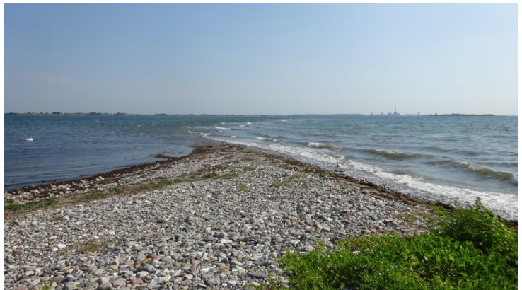
Skagens gren på Omø