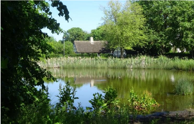
Idyllisk gadekær på Omø

Omø udtales med tryk på Om´ - en rigtig hyggelig ø og det vedlagte billede giver bare et lille indtryk af de mange forskellige naturoplevelser der findes på den lille ø.