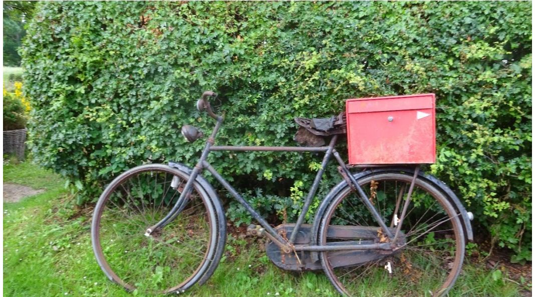
Alternativ postkasse montering på Drejø

Tidlig oppe for og endnu en tur rundt på Drejø hvor vi fandt denne alternative løsning på montering af postkassen.