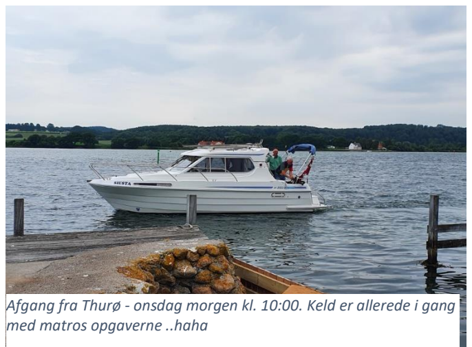
Afgang fra Thurø - onsdag morgen kl. 10:00. Keld er allerede i gang med matros opgaverne ..haha