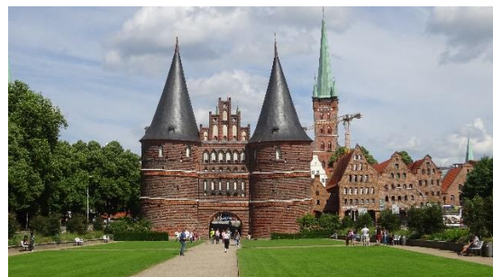
Der blev også plads til et billede af den ikoniske byport i Lübeck

Scandic – way of life. Godt nok er der flere grise i Danmark end indbyggere, men alligevel. Det så dog ud til at virke som trækplaster. Der var mange mennesker i butikken og alle skulle kigge på de små grise.